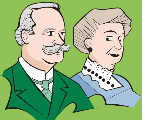
Alphonse Desjardins et son épouse Dorimène

En 1907, six ans après avoir expérimenté le concept de «l'épargne du sou», Alphonse Desjardins jetait officiellement les bases d'un service d'épargne dans la région lévisienne. Le fondateur des caisses populaires avait la profonde conviction que l'habitude de l'épargne s'acquiert quand on est jeune. Il souhaitait rendre les jeunes autonomes, responsables et compétents dès leur passage à l'école, par l'acquisition de valeurs coopératives et l'apprentissage d'une saine gestion financière. La caisse scolaire ou «l'épargne du sou» était née.